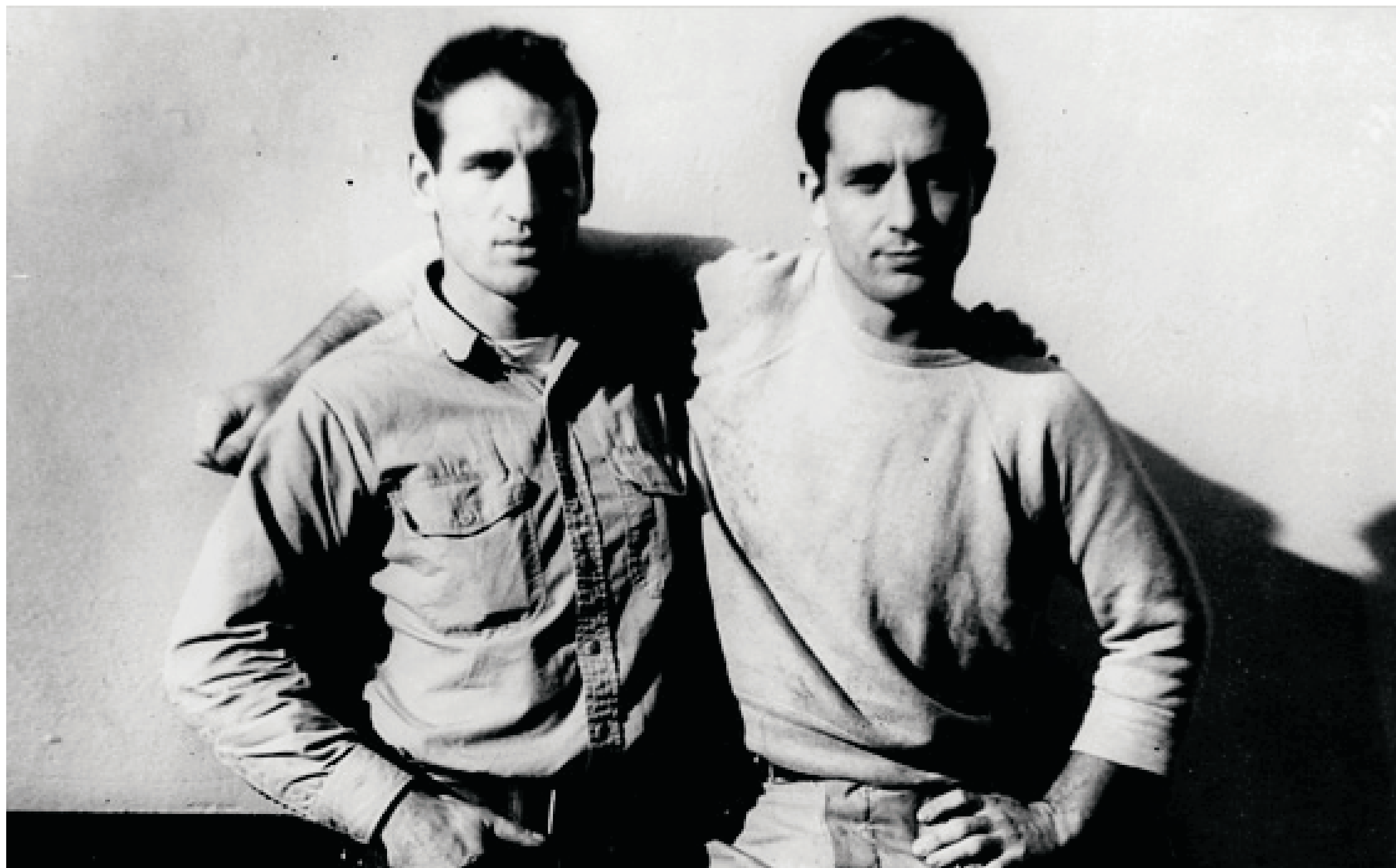
Neal Cassidy (esq.) e Jack Kerouac (dir.), uma parceria que se tornou uma lenda das estradas

biss@gazetadoparana.com.br | (45) 3218-2528